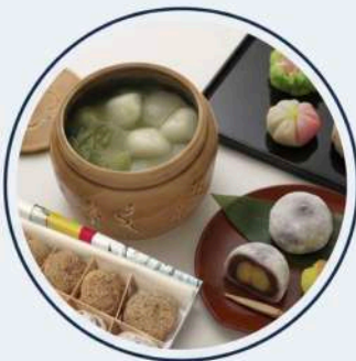
食文化：茶の湯・和菓子